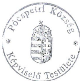
T a m á s György